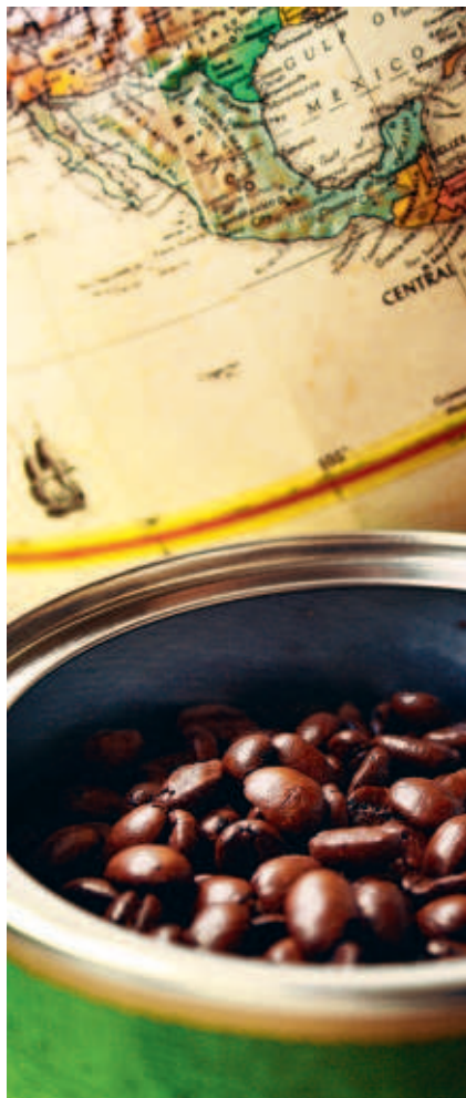
■ Nicaragua is het coming land van Midden-Amerika. ■ Koloniale grandeur in Granada.