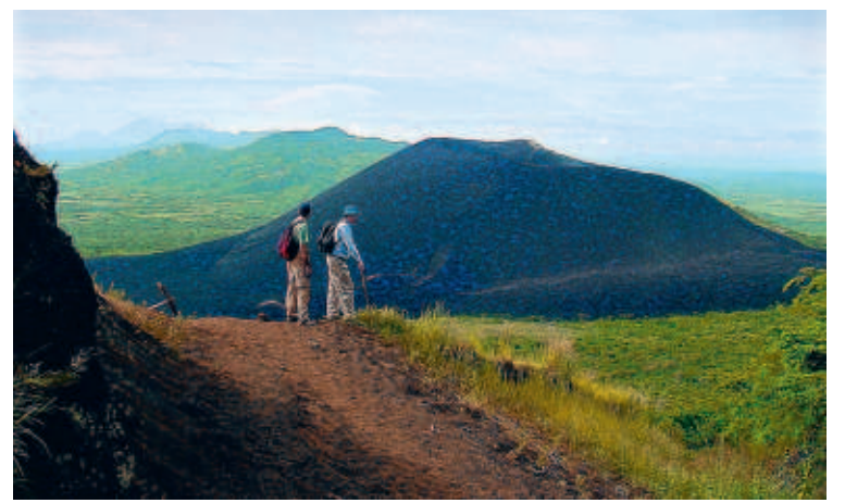
■ Wouden, stranden, eilanden, vulkanen... Nicaragua heeft het allemaal.