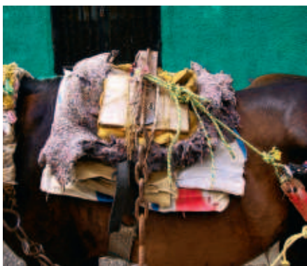
■ Paard en bus delen de weg.