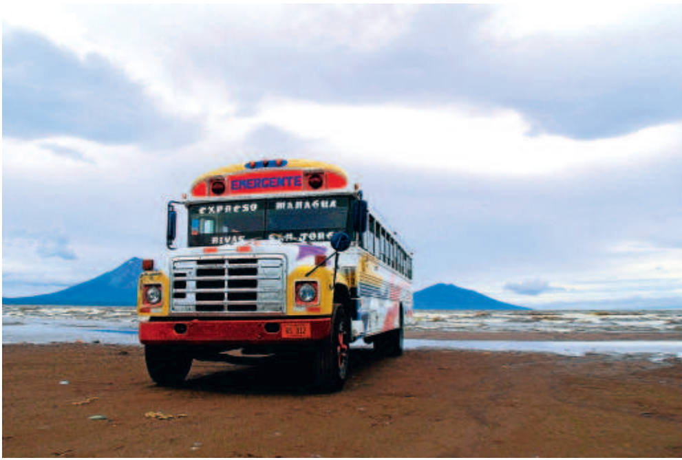
■ De bus: de ideale plek om een praatje te slaan met de bevolking.